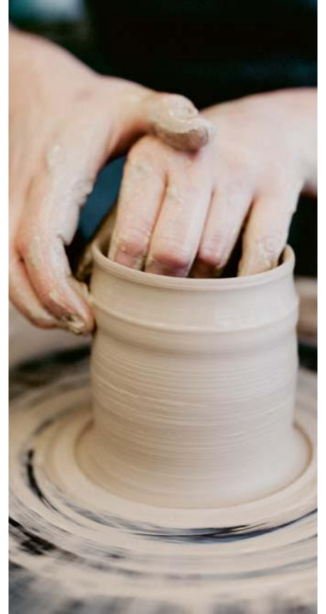
Pottendraaien vereist heel wat oefening, om van A tot Z een zelfgemaakt potje te maken.